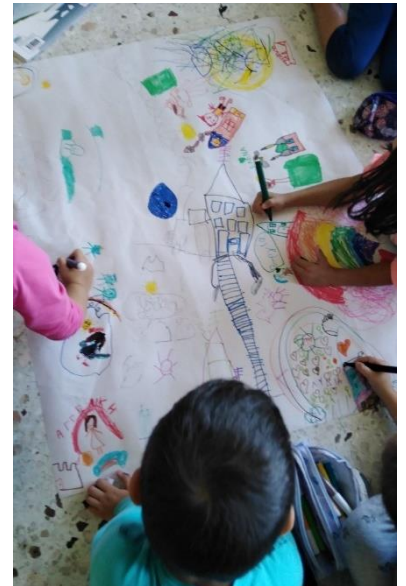
Οι μαθητές της πρώτης δημοτικού ενός σχολείου στην Ελλάδα - δεν έχουν μάθει ακόμη να διαβάζουν και να γράφουν - εκφράζονται ζωγραφίζοντας μια ιστορία "με αριθμούς και εικόνες", χορεύοντας και ακούγοντας παραμύθια από διάφορες χώρες

Από τον Σεπτέμβριο του 2022, οι εκπαιδευτικοί που συμμετείχαν στις δραστηριότητες επιμόρφωσης ξεκίνησαν την εφαρμογή του πιλοτικού προγράμματος του PASSAGE « Καθοδήγηση και Παιδιά Πρότυπα » στα σχολεία τους.