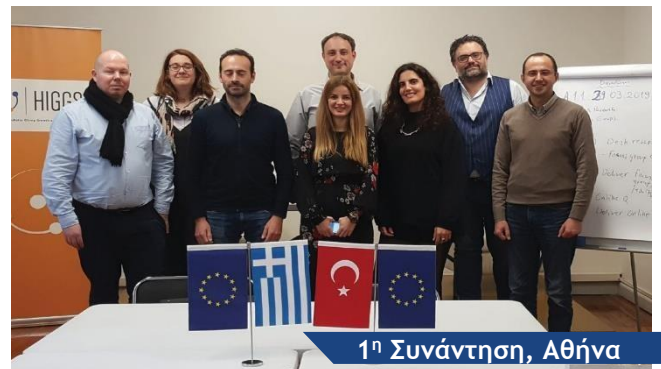
1 η Συνάντηση, Αθήνα