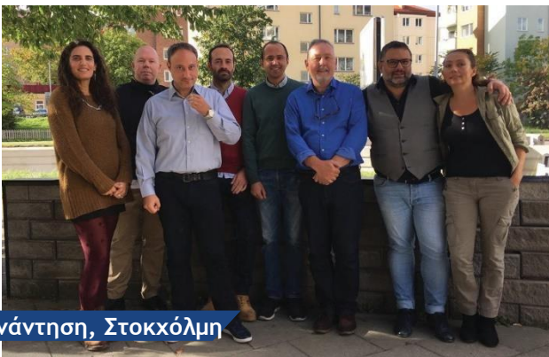
2 η Συνάντηση, Στοκχόλμη

Η ενότητα παρέχει στους εθελοντές εκπαιδευτές βασικές οδηγίες, εργαλεία, στρατηγικές, προσεγγίσεις, τεχνικές μάθησης και μεθοδολογίες για την περαιτέρω ανάπτυξη των ψηφιακών δεξιοτήτων των μεταναστών, στους ακόλουθους τομείς: Επικοινωνία, Διαχείριση πληροφοριών, Συναλλαγές, Επίλυση προβλημάτων.